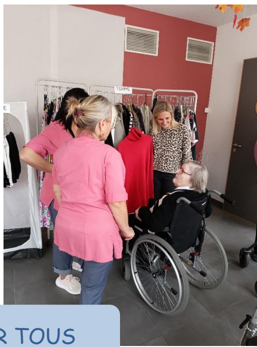
VIDE DRESSING GRATUIT POUR TOUS