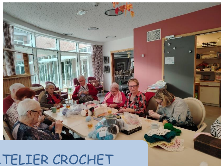
JEU DU LYNX ET ATELIER CROCHET